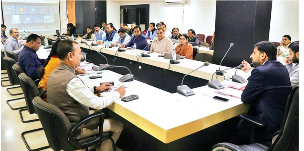
साइट पर अपलोड होगी खुलेबोर की जानकारी

कार्यक्रम स्थलों पर स्वास्थ्य शिविर लगाए जाएंगे: कलेक्टर दीक्षित ने यात्रा के संबंध में कई अहम निर्देश कलेक्टर सभाकक्ष में आयोजित समय-सीमा पत्रों की समीक्षा बैठक के दौरान दिए। उन्होंने बताया कि विकसित भारत संकल्प यात्रा के दौरान आयोजित होने वाले कार्यक्रम स्थलों पर स्वास्थ्य शिविर लगाए जाएंगे। कार्यक्रम स्थलों पर प्रधानमंत्री उज्ज्वला योजना के हितग्राहियों के आवेदन भी प्राप्त किये जायेंगे। ऐसे किसान, पशुपालक, मछुआरे, जिनके पास क्रेडिट कार्ड नहीं हैं, उनके आवेदन लेने और संबंधित बैंकों से समन्वय कर क्रेडिट कार्ड उपलब्ध कराने की कार्यवाही भी की जागी।