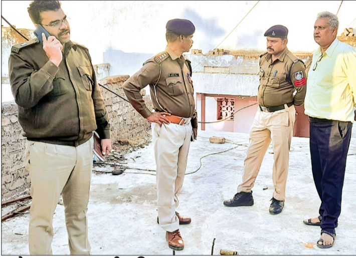
साढ़े चार लाख नकदी सहित जेवरों की चोरी